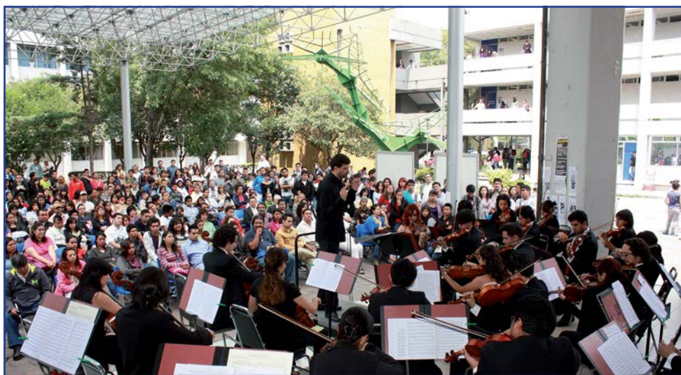
Foto 11. Orquesta Juvenil Universitaria “Eduardo Mata”. Concierto al aire libre en el Foro Cultural de campus I.

Las actividades culturales de extensión y divulgación representan otro pilar de la formación integral de los estudiantes. En este periodo participaron 204 usuarios en los 16 grupos coordinados por el Departamento de Actividades Culturales (anexo 5.9). Asimismo, se realizaron 59 actividades en las que participaron 19,025 asistentes (anexos 5.9.1, 5.9.3), entre ellas se encuentran conciertos, exposiciones, ferias y campañas, sin embargo es necesario establecer estrategias e indicadores para identificar el impacto de estas acciones en la formación de los estudiantes zaragozanos.