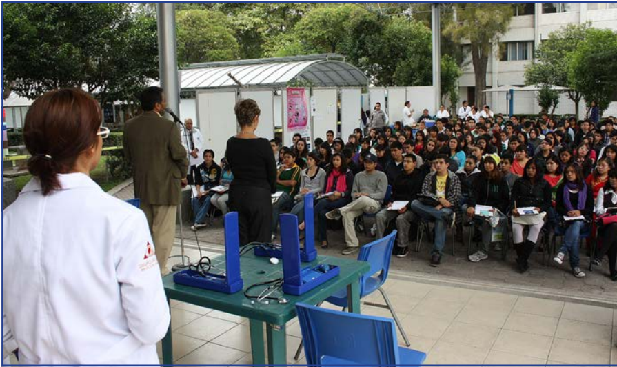
Foto 14. Programa de Autocuidado y Atención Continua a Estudiantes (AACES).

universitaria y zaragozana; este proceso inicia con la integración de los alumnos de primer ingreso a la dinámica institucional, a través de la sesión en la que el Director de la Facultad les da la bienvenida y se resaltan los símbolos, valores y fortalezas de la UNAM y de la FES Zaragoza.