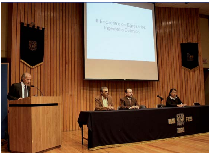
Foto 19. II Encuentro de Egresados de la carrera de Ingeniería Química.

La movilidad estudiantil es un programa de excelencia académica que promueve el intercambio nacional e internacional de los alumnos con alto rendimiento y fortalece su crecimiento y competitividad profesional y personal, para desarrollarse en un entorno global y multicultural. En