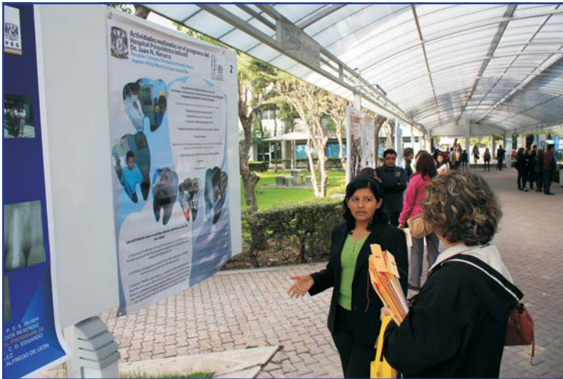
Foto 39. Exposición de carteles dentro del Coloquio de Servicio Social de Odontología.

Una actividad importante de difusión de los resultados operativos de los programas de servicio social, lo constituyó el XII Coloquio de Servicio Social de Odontología, en donde más de 260 trabajos de investigación, clínicos o comunitarios fueron expuestos por alumnos y pasantes de la carrera de Cirujano Dentista.