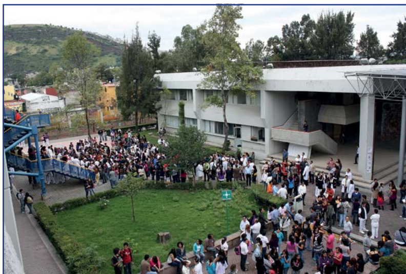
Foto 34. Macrosimulacro de sismo en campus I.