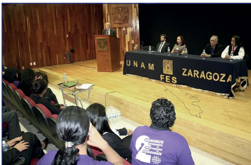
Foto 20. Segundo Congreso Estudiantil de Investigación en Psicología.