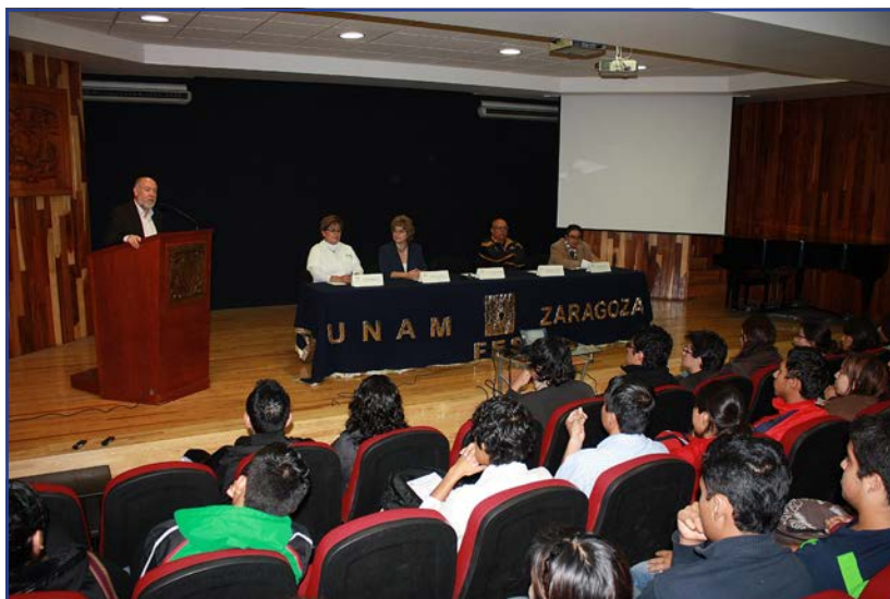
Foto 32. Inicio del Programa “Formación de Estudiantes Universitarios como Promotores de la Salud”.

Los sistemas de acceso controlado de peatones en campus I y campus II únicamente requieren ajustes en los sistemas de control, regular su mantenimiento y terminar la credencialización; lo mismo ocurre con la implementación de los sistemas de acceso controlado de vehículos, en donde sólo falta regular el mantenimiento del sistema.