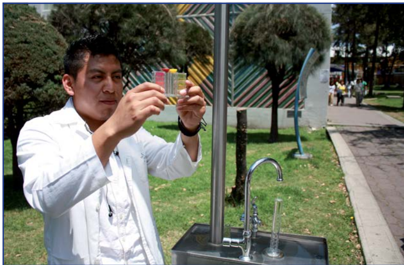
Foto 31. Pruebas bacteriológicas en agua de bebederos.

desinfección diaria de los bebederos; para ello se puso en marcha la red de agua purificada, que pretende garantizar el consumo de agua potable, disminuir el gasto generado por el consumo de agua purificada embotellada, reducir la generación de botellas de PET residual y favorecer el consumo de agua en beneficio de la salud; cada tres meses se hacen pruebas bacteriológicas al agua, en donde también es posible detectar presencia de cadmio, arsénico y plomo; cada bebedero cuenta con una llave que permite tomar el agua de manera directa y una válvula para el llenado de botellas.