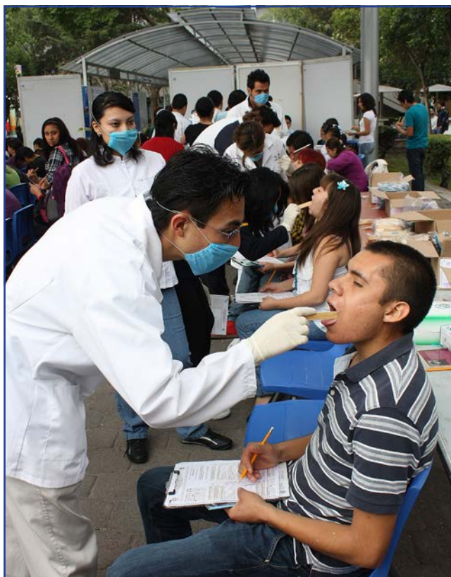
Foto 7. Revisión dental en la Aplicación de Examen Médico Automatizado en alumnos de nuevo ingreso.

Facultad y de los que están por egresar de 8° semestre ó 4° año. En 2012 se aplicó a 2,180 alumnos de nuevo ingreso y a 935 egresados (anexo 5.1).