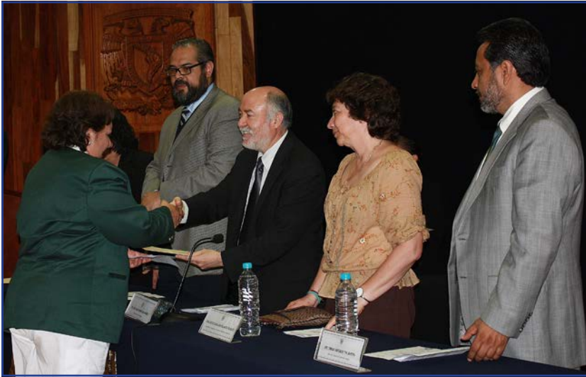
Foto 18. Nombramientos de tutores.

Dentro del proyecto institucional de seguimiento de egresados, en la carrera de Ingeniería Química se llevó a cabo el II Encuentro de Egresados, que incluyó ponencias y conferencias magistrales. En las carreras de Cirujano Dentista y Psicología se avanzó en la conformación del proyecto y en la aplicación del instrumento para su validación; la carrera de Enfermería elaboró una base de datos de las últimas tres generaciones y la de QFB estructuró un directorio de egresados y aplicó su instrumento de seguimiento en la Expo-Farma.