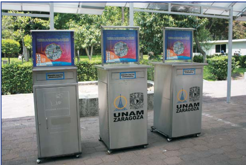
Foto 37. Programa de recuperación de medicamentos caducos.

Dentro de las acciones enfocadas a la minimización y disposición adecuada de los residuos, destaca en las carreras de Ingeniería Química y Química Farmacéutico Biológica, el programa de recuperación de medicamentos caducos y la construcción y operación de un incinerador para tratar algunos materiales peligrosos y los residuos biológicos infecciosos generados en las CUAS.