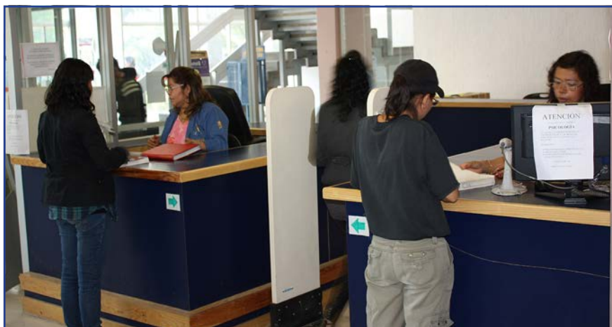
Foto 29. Atención a usuarios en la Biblioteca de Campus I.

Con respecto a la instrumentación de los procedimientos normativos en materia de servicios bibliotecarios, durante 2012 la Comisión de Bibliotecas de la Facultad sesionó en siete ocasiones, en donde coordinó y aprobó la adquisición de libros para las bibliotecas (anexo 12.2); asimismo, se organiza el proceso de descarte de materiales, propuestos como resultado de los inventarios realizados a principios de 2012.