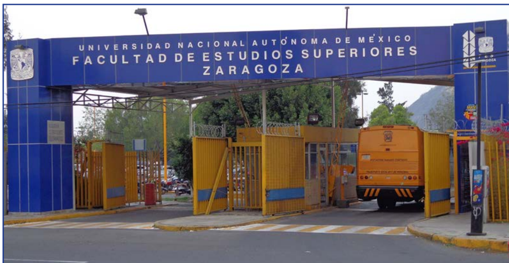
Foto 24. Pórticos de identidad institucional.

Con el propósito de mejorar la imagen de identidad de las instalaciones de la Facultad, se concluyó en los campus I y II y en todas las CUAS la construcción de pórticos en las entradas.