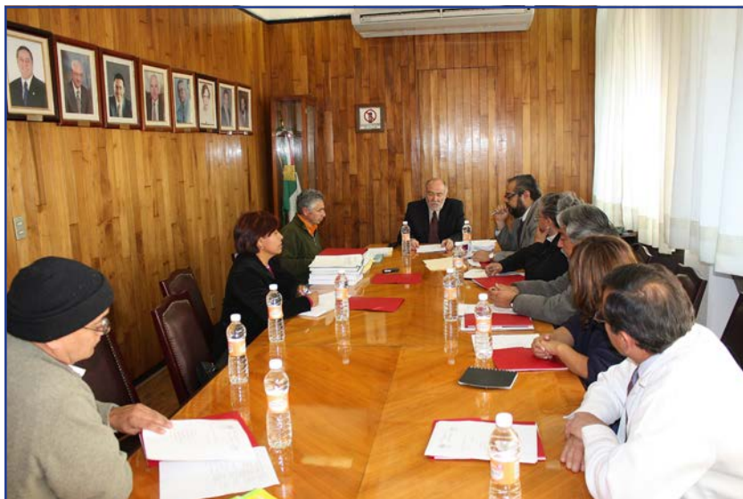
Foto 23. Comité Editorial.

El desafío de conjugar la implementación de una política incluyente y participativa, a través del trabajo colegiado, con la operación de criterios e instrumentos para ponderar académicamente la producción editorial de los profesores y grupos de trabajo académico, se logró con la instalación del Comité Editorial de la Facultad en febrero de 2012. Con este cuerpo colegiado, la generación de libros, revistas, antologías, manuales de prácticas, guías de laboratorio y materiales de apoyo académico, impresos y electrónicos, se inserta en una trayectoria institucional que responde al propósito de mejorar la calidad de la producción editorial de la Facultad y a la existencia del canal idóneo para instrumentar las propuestas de los profesores, con el propósito de ampliar las opciones que facilitan la enseñanza y el aprendizaje. En este sentido, actualmente todas las publicaciones del plantel son revisadas por pares y posteriormente dictaminadas por el comité editorial.