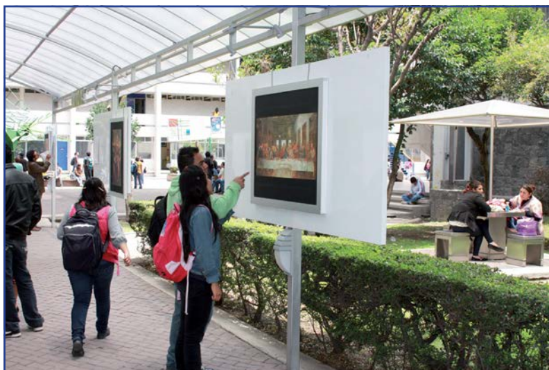
Foto 12. Exposición itinerante.