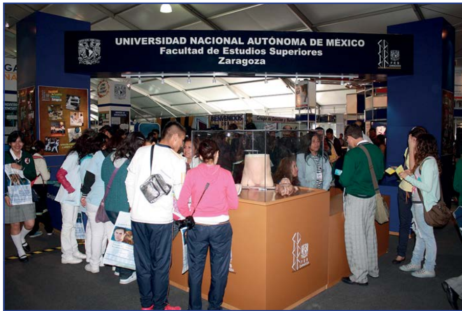
Foto 41. Participación de la FES Zaragoza en la exposición “Al Encuentro del Mañana”.