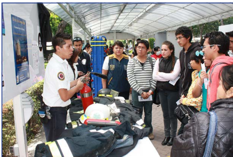
Foto 35. Feria de protección civil.

En lo referente al desarrollo y mantenimiento ecológico de las áreas verdes de la Facultad, se realizó el diagnóstico de la situación ecológica y se gestionó la adquisición de ejemplares para la reforestación con el propósito de incrementar la diversidad de especies. Asimismo, a través de la Unidad de Investigación en Ecología Vegetal se estableció el jardín xerófito de divulgación científica, situado al lado oriente del edificio de gobierno de campus I en una superficie de 506 m 2 .