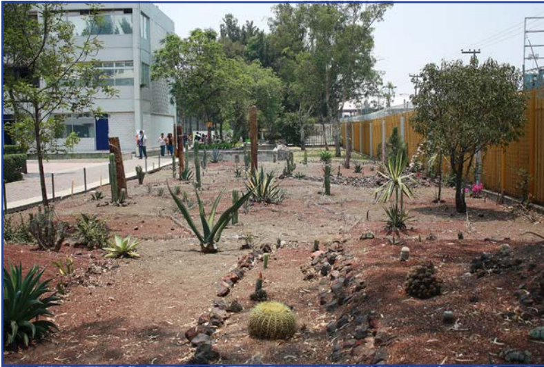
Foto 36. Jardín xerófito en campus I.

Dentro de las acciones enfocadas a la minimización y disposición adecuada de los residuos, destaca en las carreras de Ingeniería Química y Química Farmacéutico Biológica, el programa de recuperación de medicamentos caducos y la construcción y operación de un incinerador para tratar algunos materiales peligrosos y los residuos biológicos infecciosos generados en las CUAS.