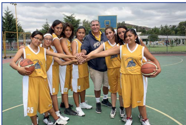
Foto 10. Equipo campeón de baloncesto de los Juegos InterFES.

del año anterior. Con respecto a francés y portugués, que complementan la oferta de idiomas de la Facultad, en este periodo se inscribieron 144 alumnos a los cursos y 24 solicitaron examen de acreditación (anexos 5.8, 5.8.1).