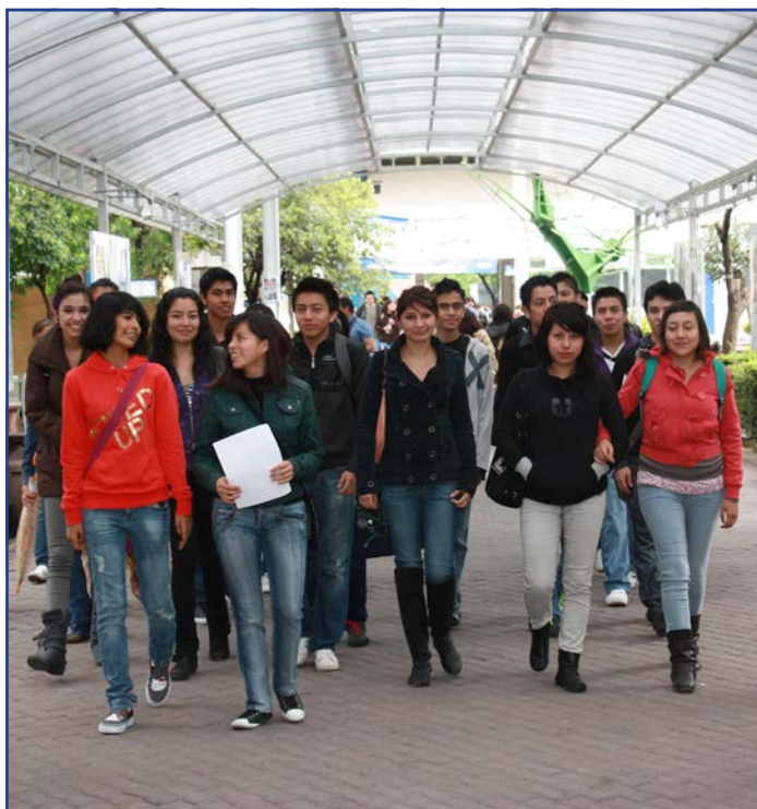
Foto 16. Ingreso de la generación 2013.

y hábitos positivos (anexo 2.5). Asimismo, se inició la implementación de tutorías en forma grupal y se dio continuidad tanto a la formación de nuevos tutores, como a la realización del Encuentro de Tutores que se realiza anualmente para analizar y reflexionar colegiadamente acerca de las experiencias, estrategias y resultados de las tutorías.