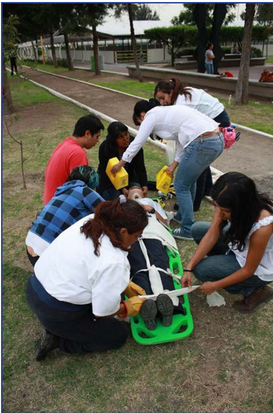
Foto 33. Curso-taller de primeros auxilios.

Dentro de este Programa, se conformó el Cuerpo de Atención de Emergencias de la Facultad de Estudios Superiores Zaragoza (CUATE FES-Z), con 25 brigadistas de la comunidad, que organizaron dos cursos-taller de Primeros Auxilios Esenciales con 102 participantes y 11 talleres de Reanimación Cardio-Pulmonar (RCP) con 400 participantes.