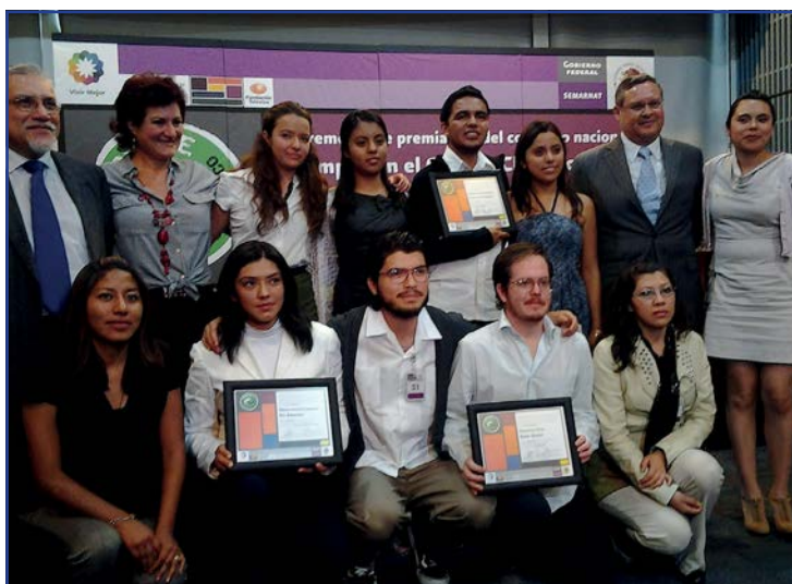
Foto 21. Tesistas de la carrera de Biología ganadores en el Concurso Nacional “Rompe con el Cambio Climático”.

Uno de los principales programas institucionales de la UNAM que se promueve en la Facultad para impulsar y financiar la investigación científica y el desarrollo tecnológico es el Programa de Apoyo a Proyectos de Investigación e Innovación Tecnológica (PAPIIT). En este periodo se logró un incremento en el número de proyectos, ya que en 2011 se aprobaron 11 y en 2012 se adicionaron 15 que, sumados a los renovados, alcanzaron un total de 34 investigaciones desarrolladas con el apoyo de este programa (anexos 7.1, 7.2).