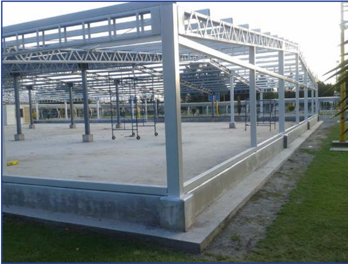
Fotos 26 y 27. Construcción de biblioteca provisional en campus II.

edificio preexistente sin usarlo al 100%, para ello se realizaron las adecuaciones que incrementan la seguridad de trabajadores y usuarios y mejoran el servicio; estas obras consistieron, entre otras, en la modificación y ampliación de la salida del edificio para facilitar su desalojo en caso necesario, instalación de sensores nuevos, apertura de una nueva salida de emergencia, aumento del número de terminales en los módulos de préstamo y devolución y recorrido del acervo bibliográfico general hacia la zona más estable del edificio y para ampliar las rutas hacia las salidas de emergencia.