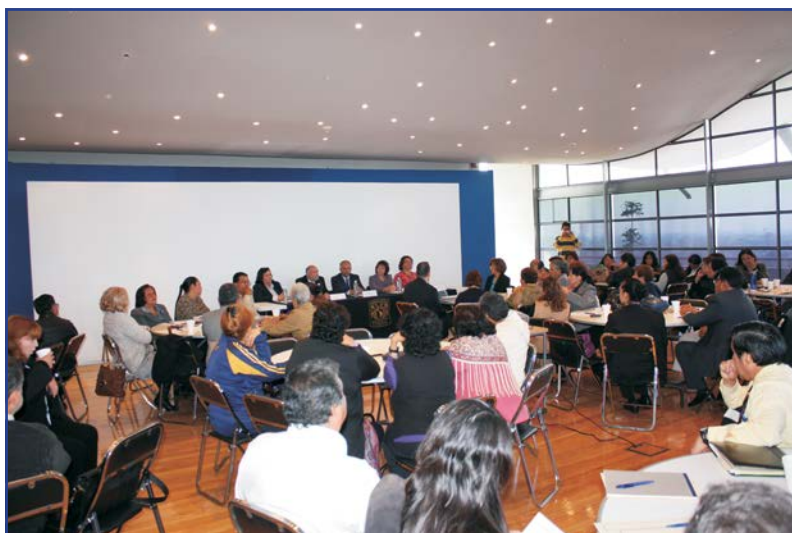
Foto 17. Encuentro de Tutores.

y hábitos positivos (anexo 2.5). Asimismo, se inició la implementación de tutorías en forma grupal y se dio continuidad tanto a la formación de nuevos tutores, como a la realización del Encuentro de Tutores que se realiza anualmente para analizar y reflexionar colegiadamente acerca de las experiencias, estrategias y resultados de las tutorías.