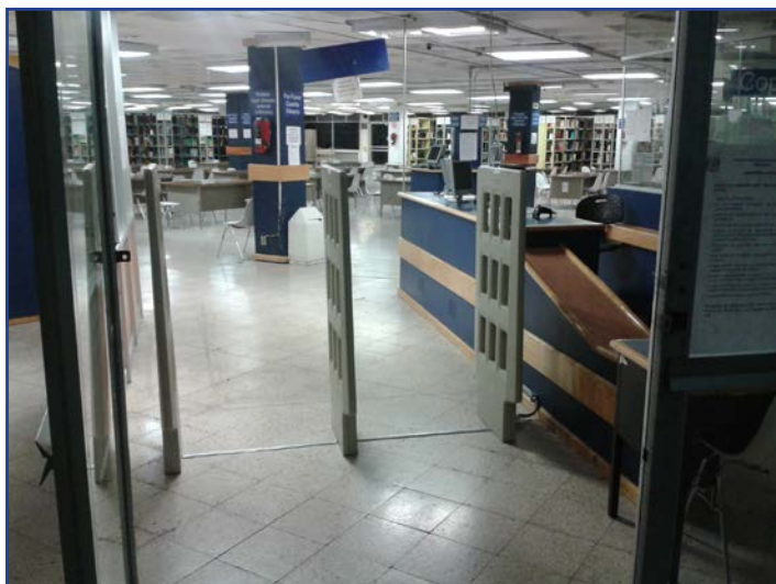
Foto 28. Nuevos sensores en la biblioteca actual de campus II.

Con respecto al desarrollo de infraestructura de apoyo a las actividades culturales, de difusión y divulgación, se instalaron domos en las explanadas de campus I y II para crear los Foros Culturales I y II y en instalaciones deportivas se colocó la malla de la cancha de fútbol rápido y el empastado de la cancha de fútbol soccer.