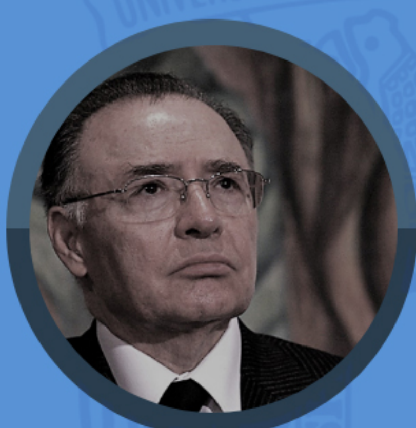
Dr. Carpizo Mcgregor

El 13 de diciembre de 1988, el rector Jorge Carpizo Mcgregor emitió el "Acuerdo para la protección, uso y conservación del patrimonio histórico documental de la UNAM".