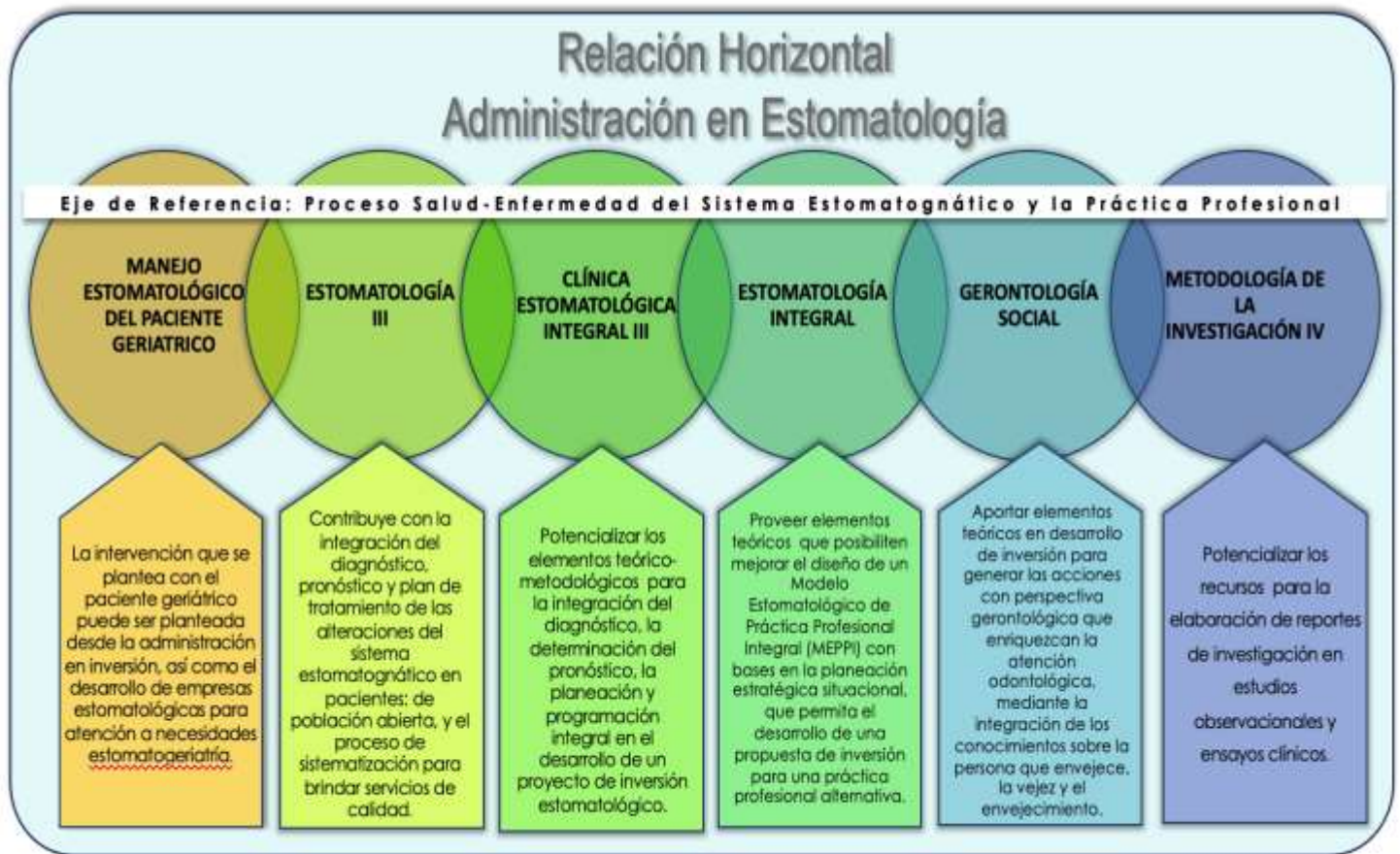
Figura 3. Relación horizontal