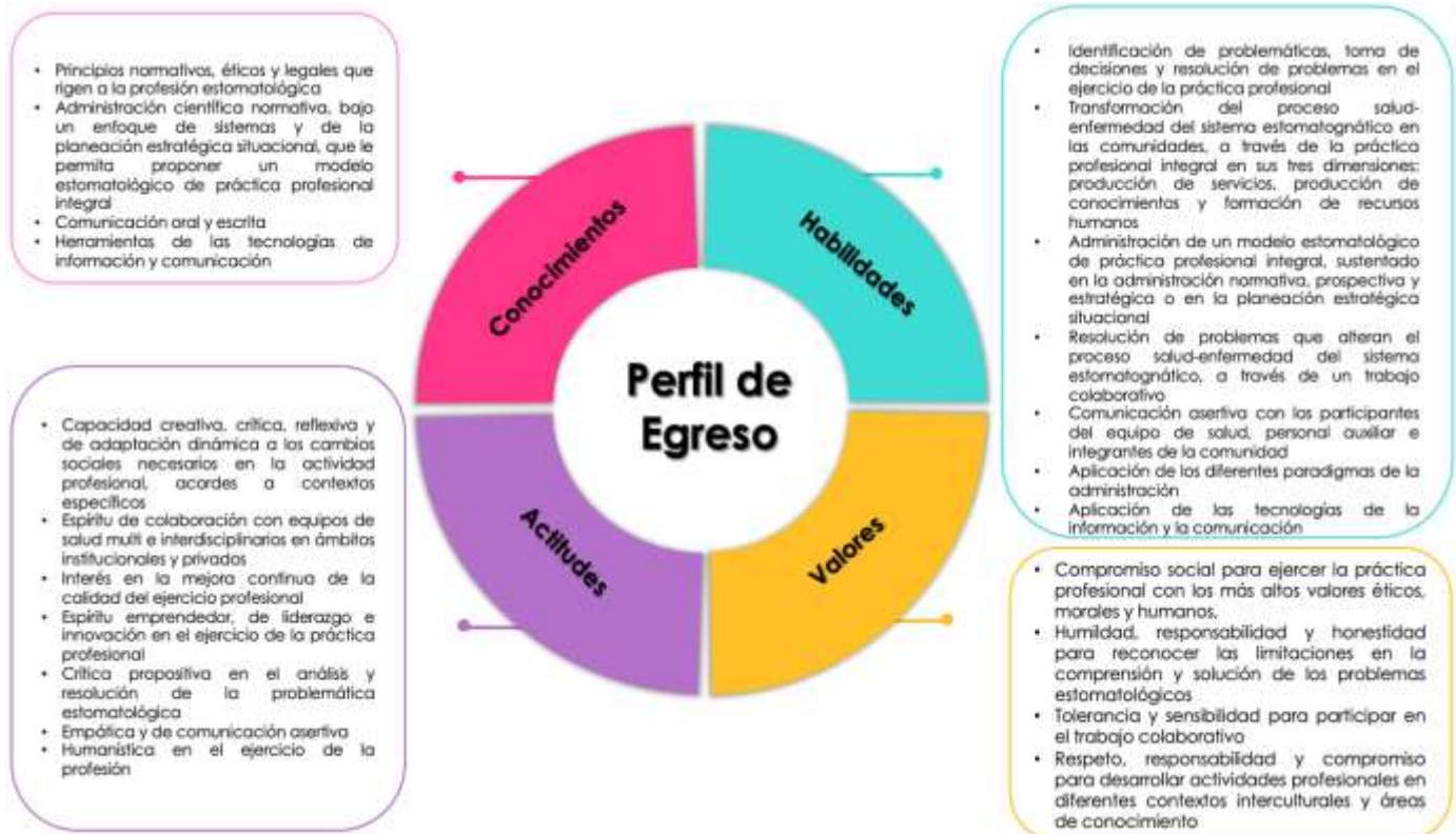
Figura 2. Perfil de egreso

El programa de optativa de Administración en Estomatología aporta conocimientos, habilidades, actitudes y valores al perfil de egreso para la y el estudiante sea capaz de abordar el proceso salud-enfermedad del sistema estomatognático de manera integral. (Ver Figura 3)