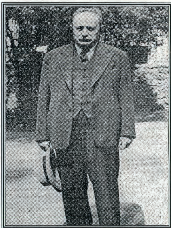
JOSÉ VASCONCELOS RECTOR DE LA UNAM 1920