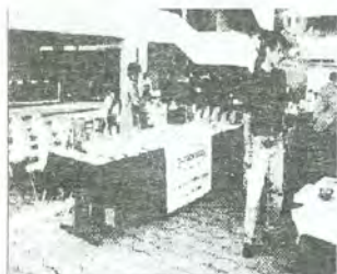
Expositores en la Feria.