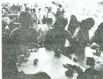
Taller de Origami Geométrico.

La biblioteca agradece a las casas editoriales, al personal de apoyo y, principalmente, a la comunidad zaragozana su valiosa participación para la realización de este evento.