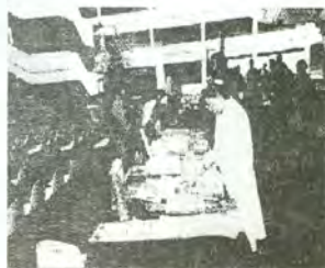
Expositores en la Feria.

La biblioteca de Campus II, organizó, como lo ha venido haciendo desde hace 3 años, la III Feria Exposición del libro 2002, que se realizó del 20 al 24 de Mayo en la explanada de Campus II. En esta ocasión participaron 18 expositores (10 mas que el año pasado).