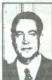
JAIME TORRES BODET

N ació en la ciudad de México, el 17 de abril de 1902, y estudió en la escuela primaria anexa a la Normal, en la Escuela Nacional Preparatoria, en la Escuela de Leyes y en la Facultad de Altos Estudios de la Universidad Nacional. Antes de los veinte años enseñó literatura en la Escuela Preparatoria y fue secretario de la dirección de esa escuela, de donde