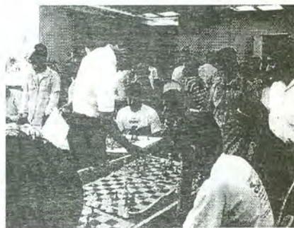
Simultáneas de Ajedrez.