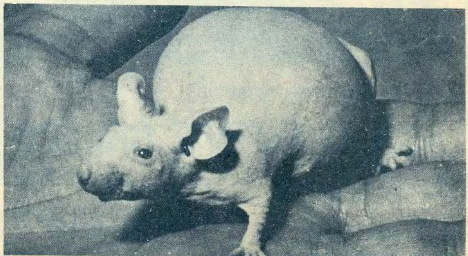
Nuevo espécimen de rata desarrollado en la ENEP Zaragoza.

Para concluir, el encargado del Bioterio añadió que si bien por lo general la rata tiene entre 12 y 14 animales por camada, solamente se le dejan ocho animales en crianza, debido a que de las 12 mamás con que cuenta solamente 8 funcionan. De esta forma es preferible sacrificar a los roedores menos desarrollados, con tal de que los más sanos se crien en buenas condiciones. ▲