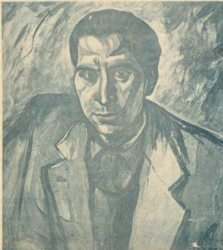
Retrato de Luis Cardoza y Aragón.

"Se ha creado el mito de un Orozco sombrío. Si se singularizó por su sentido trágico, no descuidemos, sin embargo, que en él alentó, como en ningún otro pintor contemporáneo, un gran humorista. Le repugnaba la vulgaridad, la sumisión, la verborrea; que se le encasillara, que se le pusieran etiquetas. Era transparente y sencillo, de corazón sabio y cabal y de una sinceridad infinita. Cuidaba su tiempo. Visitaba a muy pocos amigos y muy pocos lo visitaban. Le importaban un comino las polémicas, los escenarios y la publicidad. Pintaba, y entonces vertía su vida".