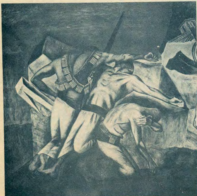
La Trinchera, 1922-26, Mural Escuela Nacional Preparatoria.

Los pintores y los escultores de ahora serían los hombres de acción, fuertes, sanos e instruidos; dispuestos a trabajar como un buen obrero ocho o diez horas diarias. Se fueron a meter a los talleres, a las universidades, a los cuarteles, a las escuelas, ávidos de saberlo y entenderlo todo y de ocupar cuanto antes su puesto en la creación de un mundo nuevo. Vistieron su overol y treparon a sus andamios". ( Autobiografía , p. 64—65).