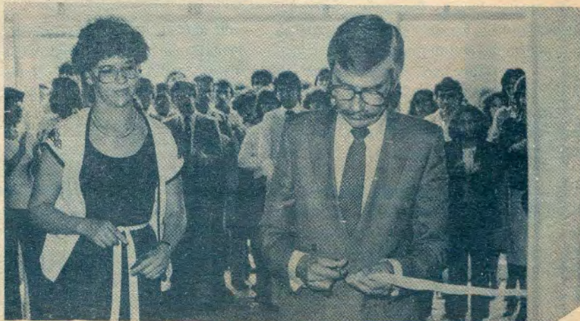
Reinauguración de la biblioteca de Campo I.

Por último, en el área de servicio al público, ubicada a la entrada del CRA, se brinda orientación, se prestan libros y se reciben aquellos volúmenes prestados a domicilio.