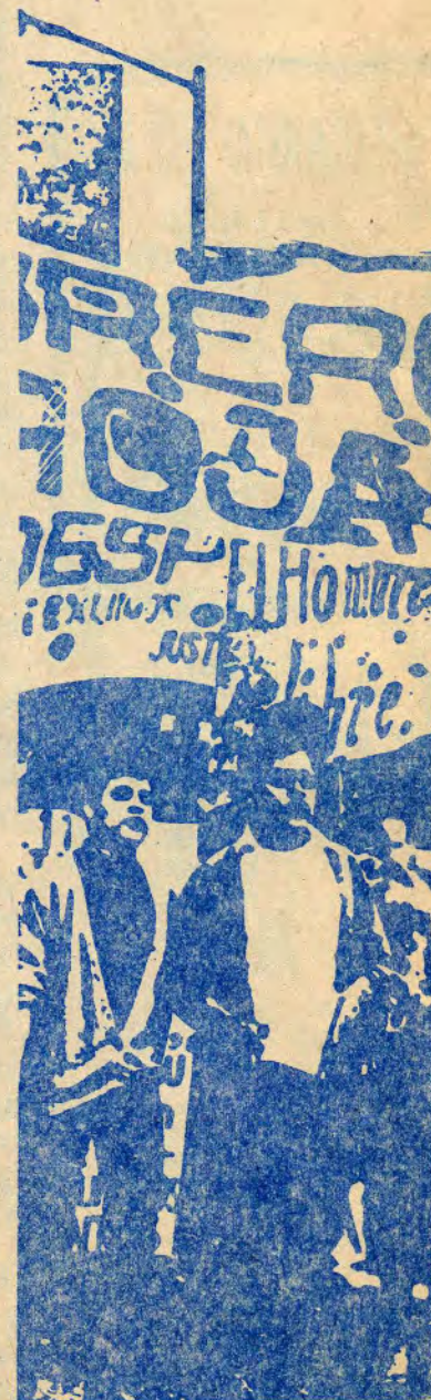
Por: FABIENNE JAFRENOV