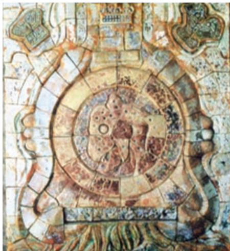
Luis Nishizawa, Calmécac , 1997. Edificio de Gobierno, Campus I, FESZ.

En él se puede apreciar el ocelotl, símbolo de cultura prehispánica que significa tigre y es considerado un guerrero valiente, además representa un glifo en la tierra, que significa Iztapalapa. Nombre que se le daba al