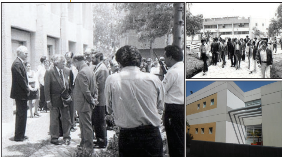
Instalaciones de la ENEPZ