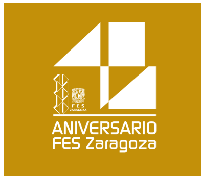
Fondo sólido claro