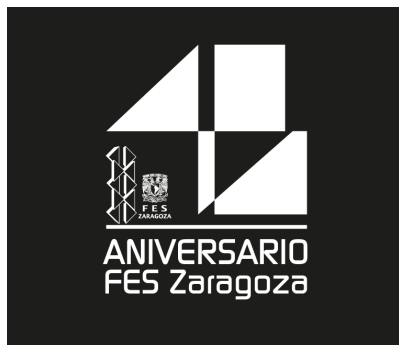
Fondo sólido negro

El fondo deberá utilizarse de acuerdo a las necesidades