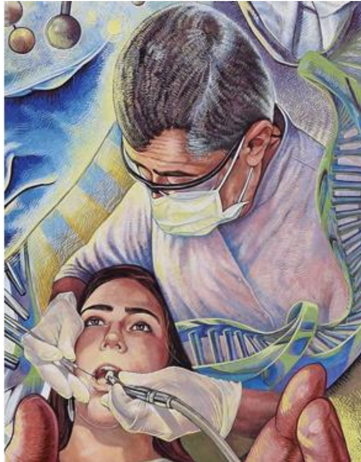
Nieto, A. (2016). Fragmento del Mural Simbiosis Universitaria [Silicato Potásico. Dimensiones: 14.30X4.72 M.] En la Facultad de Estudios Superiores Zaragoza UNAM