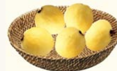
Figura 3. Ejemplo de Actividad matemática estructurada.

Una canasta tiene 6 guabayas. Si se compran 7 canastas, ¿cuántas guayabas habrá en total?