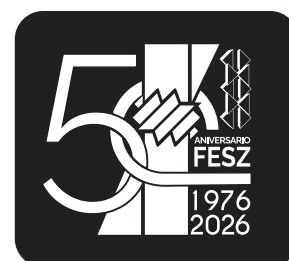
Logotipo color blanco

El fondo deberá utilizarse de acuerdo a las necesidades