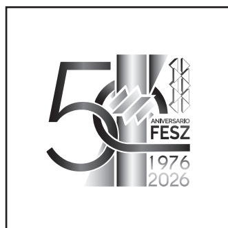
Logotipo en grises degradados