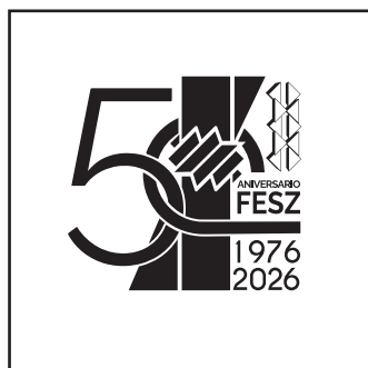
Logotipo en negro sólido