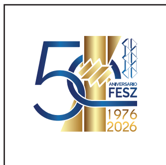
Logotipo con colores degradados