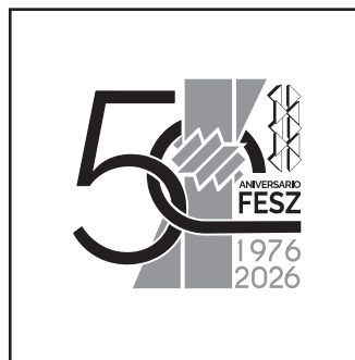
Logotipo en escala de grises